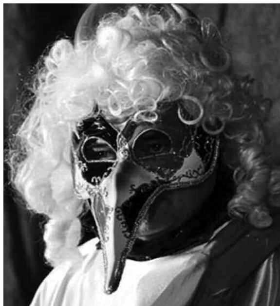
Máscara de carnaval veneciano.

La fiesta más popular de Venecia es el carnaval, cuya tradición se remonta posiblemente al siglo XI cuando la ciudad comenzaba a dominar importantes zonas del mar Mediterráneo. Oficialmente, se declaró como festividad suprema durante el siglo XIII y hacia el XVII. Era el momento en el que la nobleza se disfrazaba para salir y mezclarse con el pueblo. Desde entonces, las máscaras son el elemento más importante del carnaval.