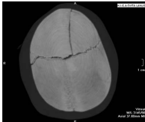
Fractura lineal sagital frontal, extendida a sutura coronal con diastasis de la misma y extensión de la fractura a parietal derecho, simulando un mouse de computadora.