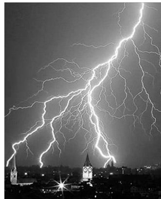
Figura 2 La tormenta eléctrica es un fenómeno natural caracterizado por rayos y fuertes truenos.