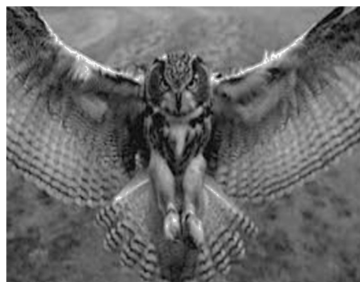
Figura 2 Un búho en su hábitat.