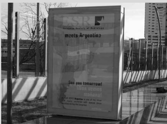
Un cartel en la entrada del palacio de conferencias anuncia la participación especial argentina en el ECR 2010.