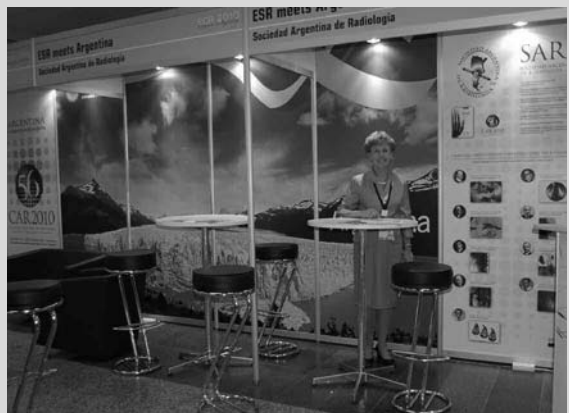
La presidenta del Congreso Europeo en el stand argentino.