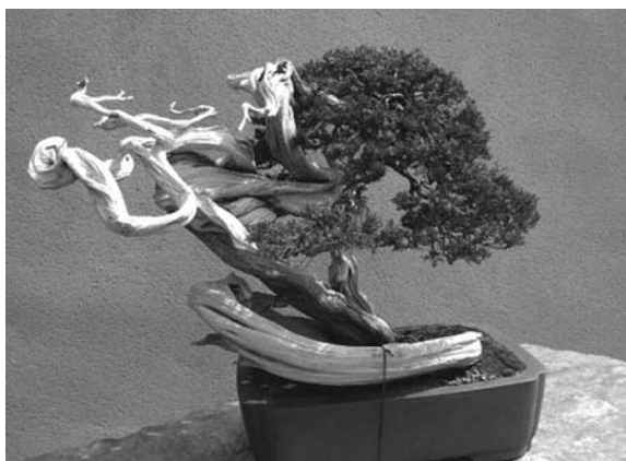
El arte del Bonsai - Conífera Californiana